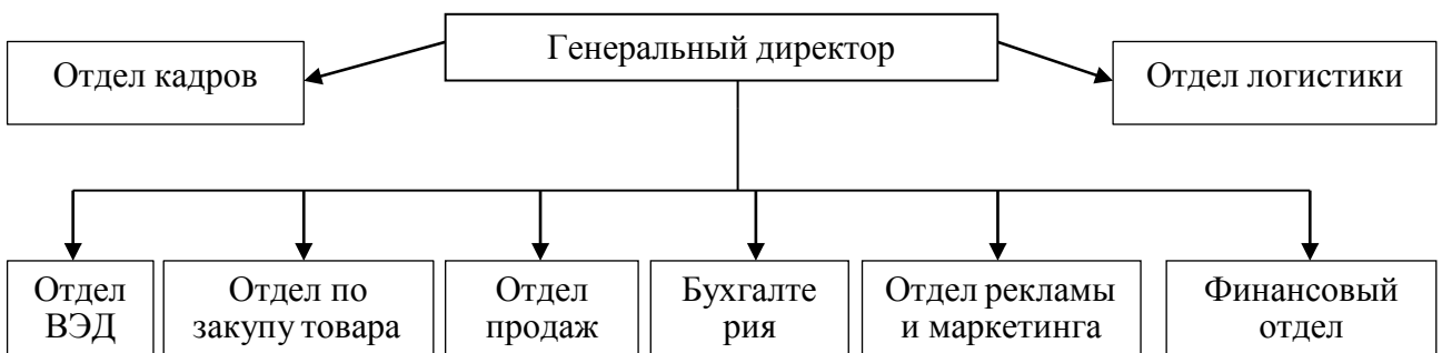
Рисунок 1.3 – Организационная структура ООО «Востокшинторг» в 2022 г.

При ссылках на иллюстрации следует писать «... в соответствии с рисунком 2» при сквозной нумерации и «... в соответствии с рисунком 1.2» при нумерации рисунка в пределах раздела.