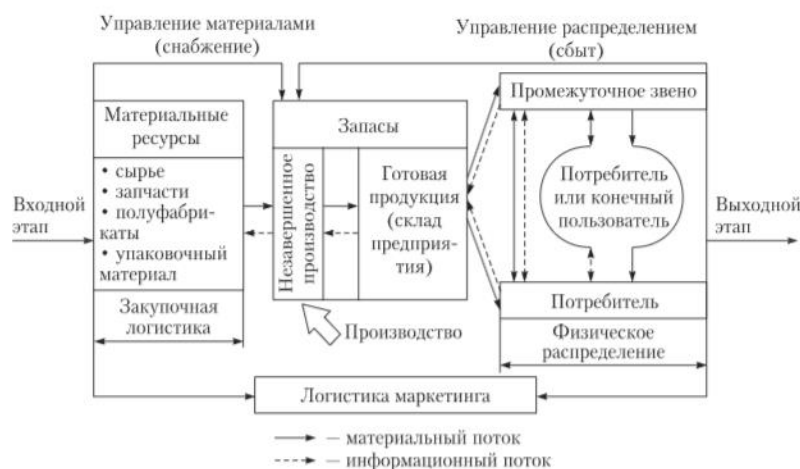
Рисунок 1 – принцип логистической системы

1. Задание: Один из принципов, разработанной учеными логистической системы, иллюстрирующий ее концепцию (принципы), приведен на рисунке 1, дайте ему характеристику.