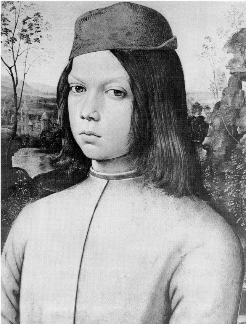
Рис. 16. Пинтурикко