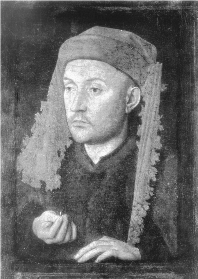
Рис. 5. Ян Ван Эйк