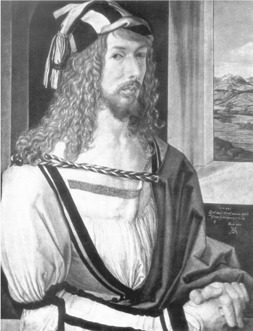
Рис. 8. Альбрехт Дюрер