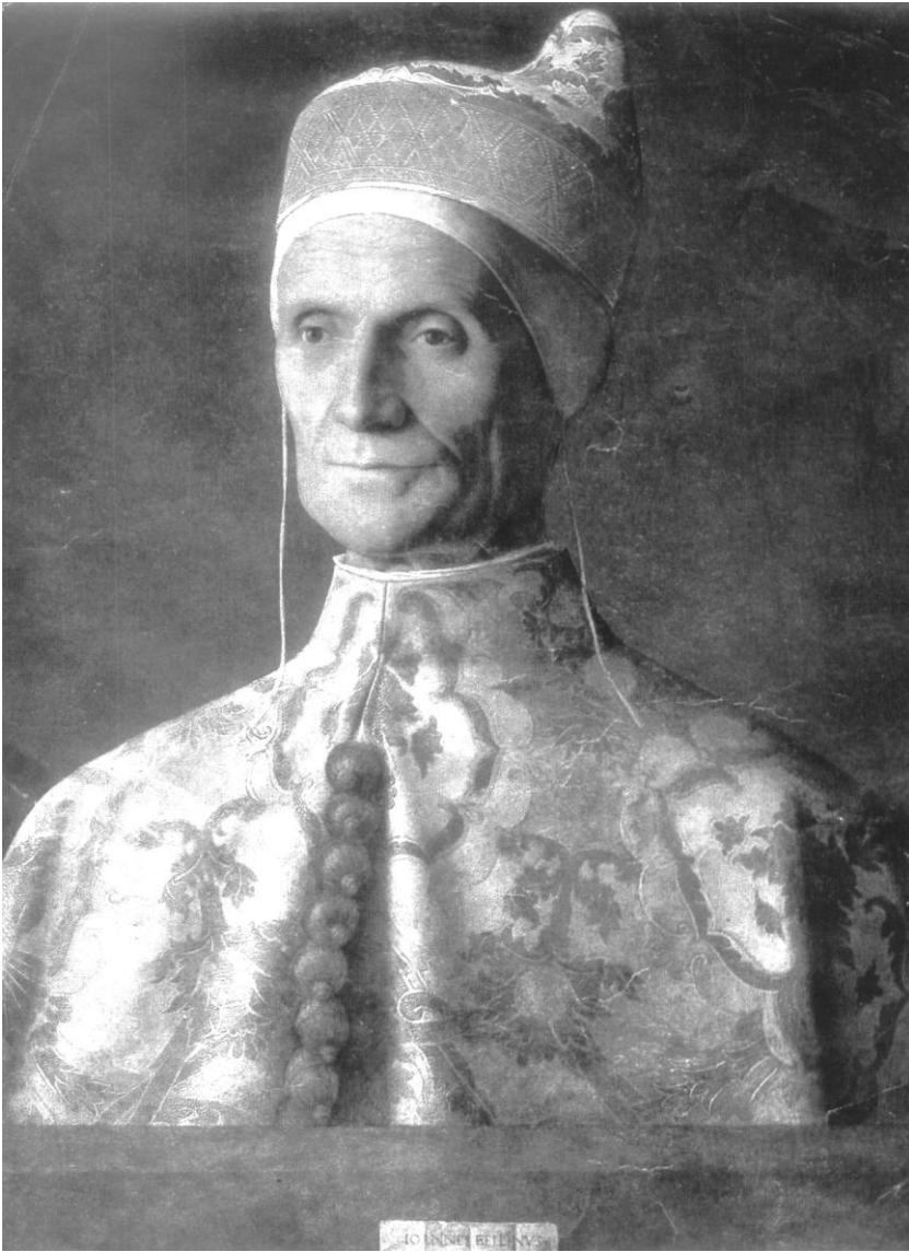
Рис. 7. Джованни Беллини