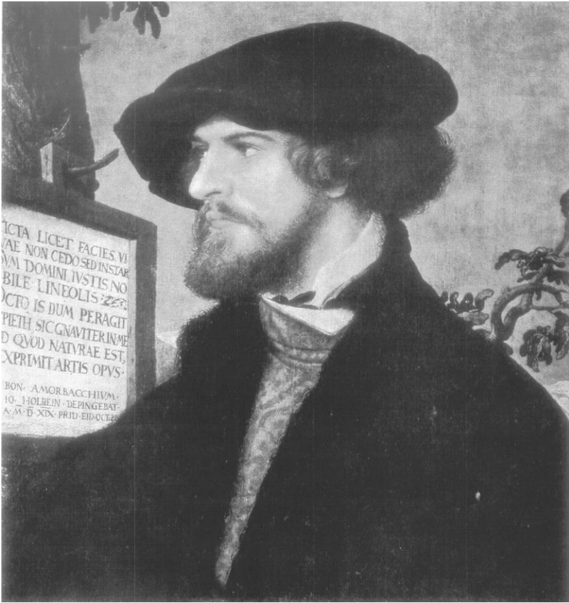
Рис. 3. Ханс Холбейн Младший