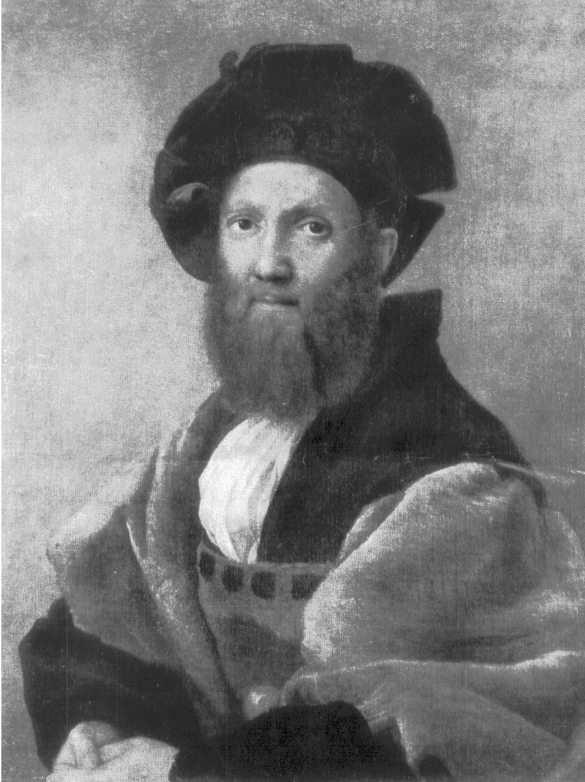
Рис. 10. Рафаэль Санти