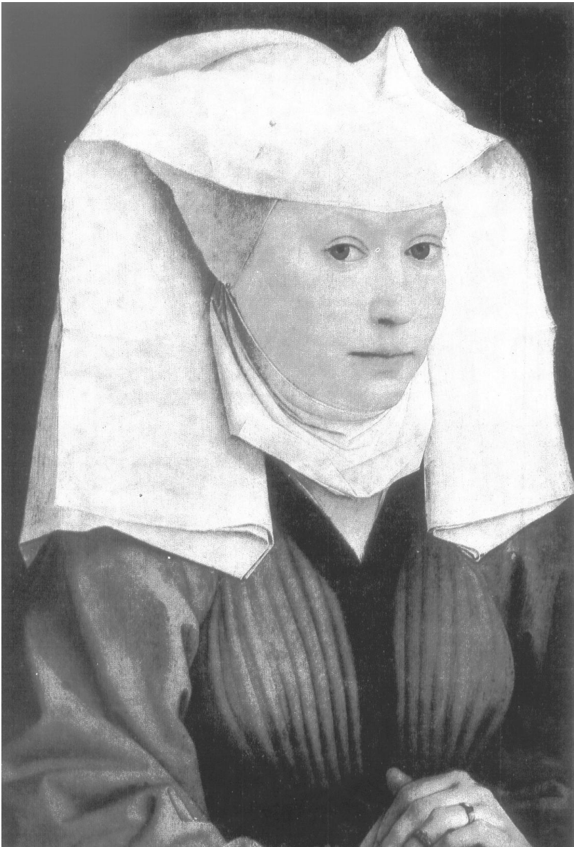
Рис. 6. Рогир Ван Дер Вейден