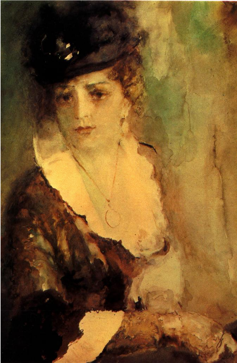
Рис. 13. А.В. Фонвизин