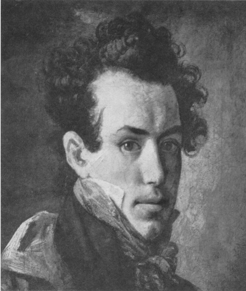
Рис. 12. О.А. Кипренский