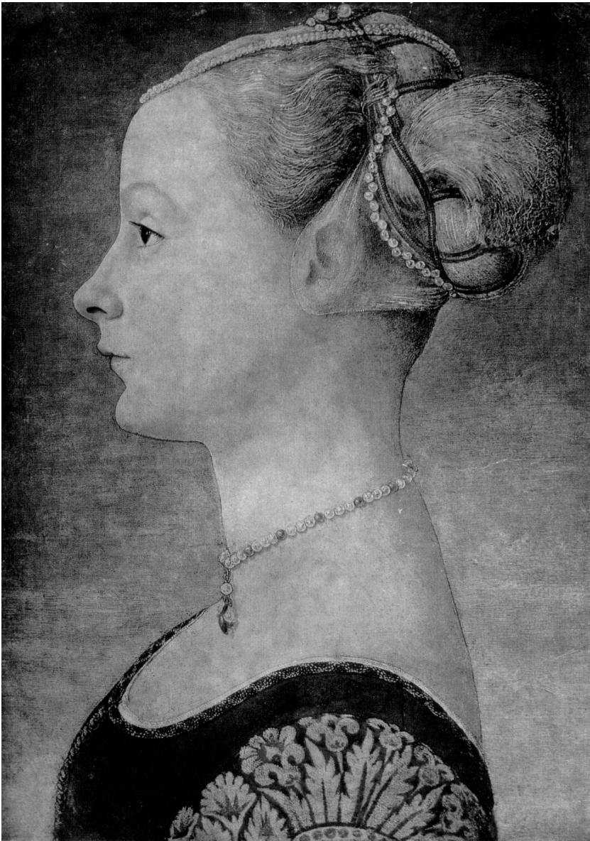
Рис. 17. Антонио Поллайоло