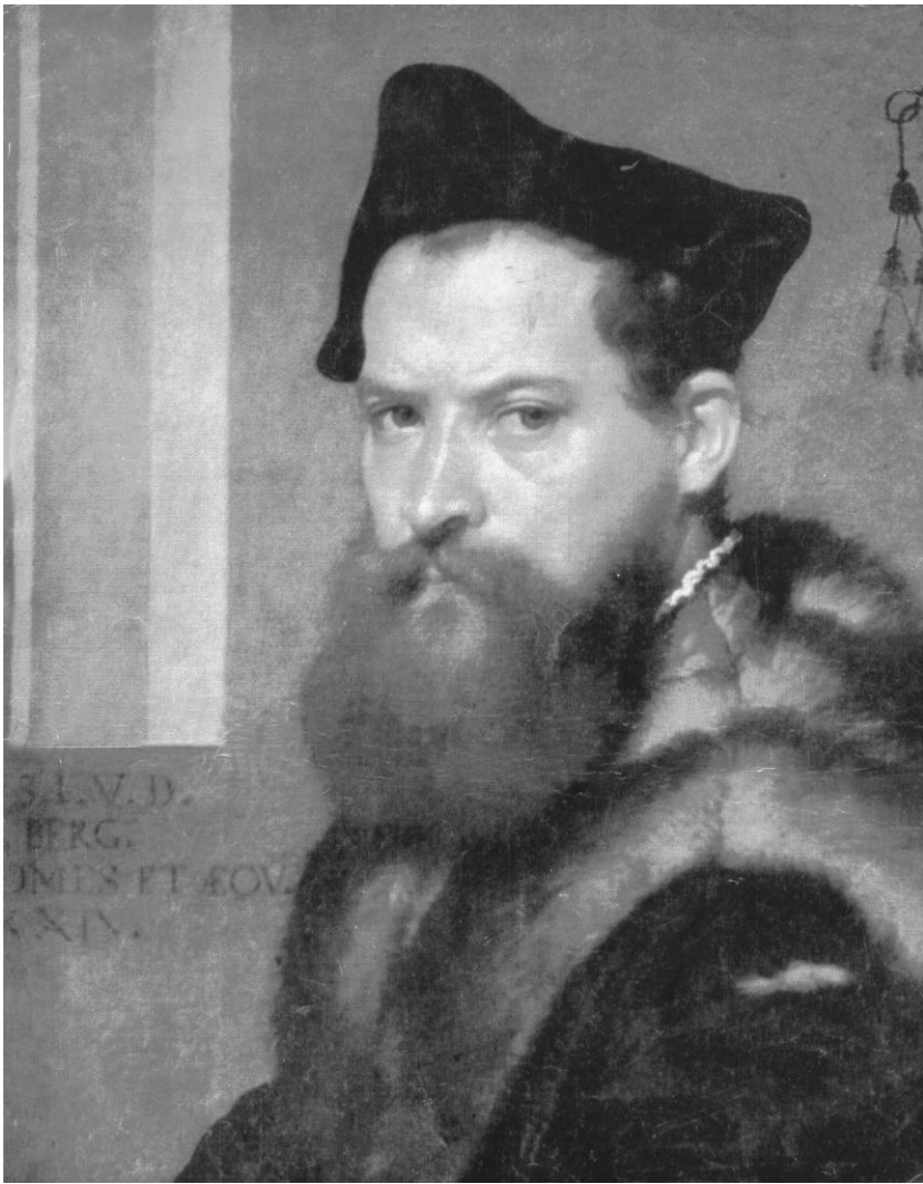
Рис. 4. И. Репин