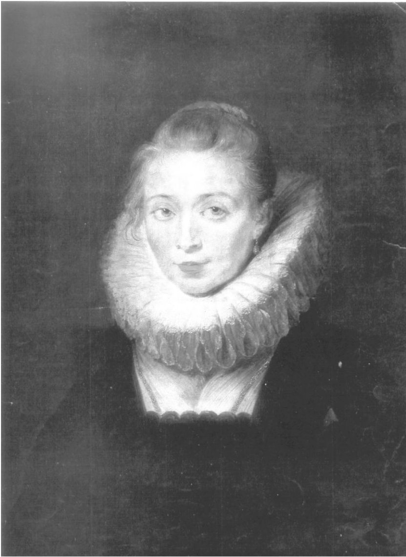
Рис. 2. Питер Пауль Рубенс