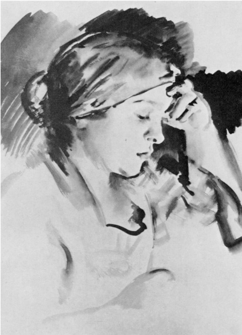
Рис. 11. Н.А. Тырса