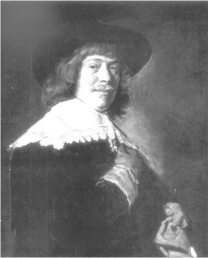
Рис. 9. Франс Халс