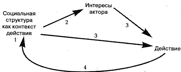
Рис. 1. Обобщающая модель действия Р. Берта

6. Вспомните какое-либо событие, где субъект действовал под давлением социальной структуры. Используя обобщающую модель Рональда Берта, приведенную ниже, проанализируйте действие субъекта в рамках социальной структуры.