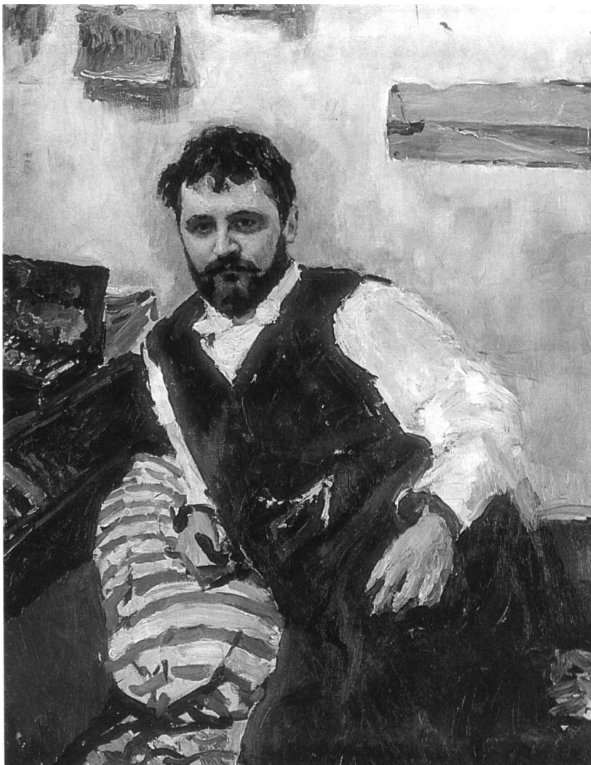
В.А. Серов. Портрет Константина Коровина