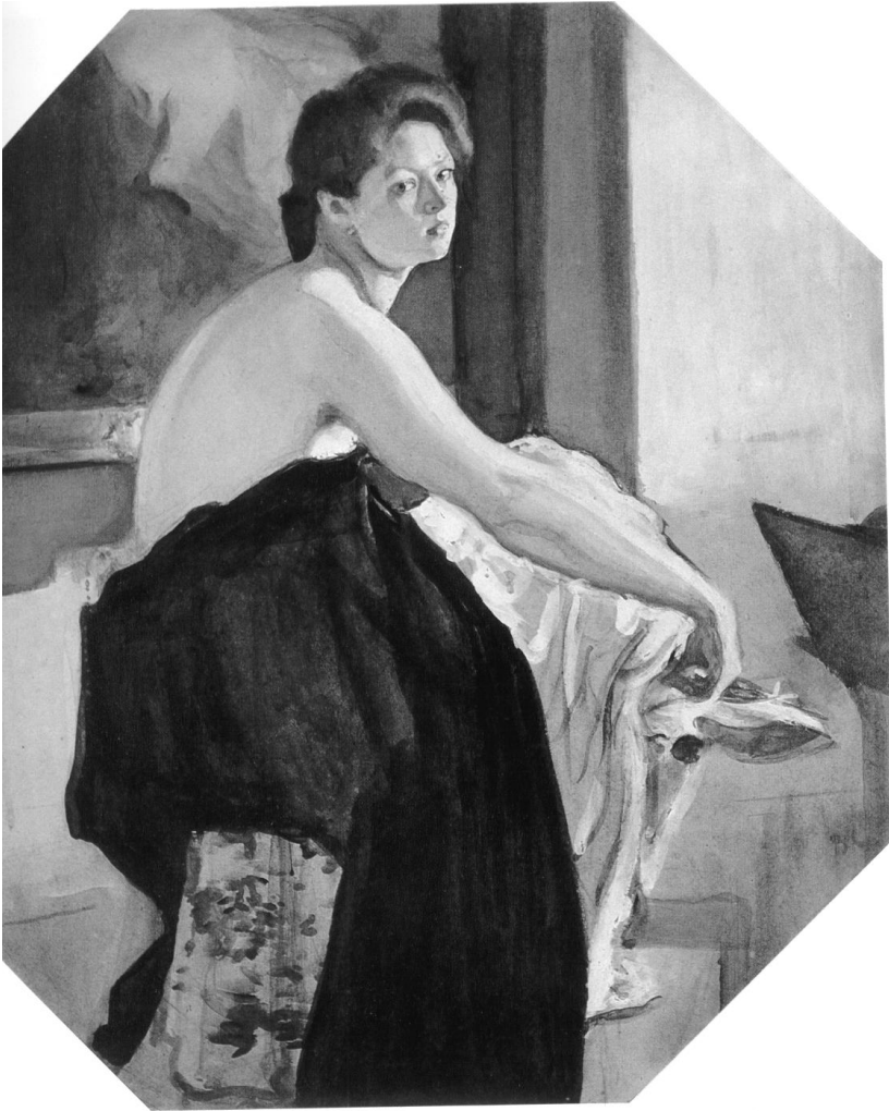
В.А. Серов. Натюрщица.1905