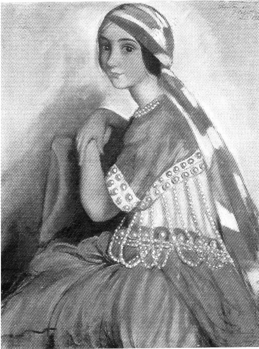
З.Е. Серебрякова. Портрет балерины Л.А. Ивановой в театральном костюме