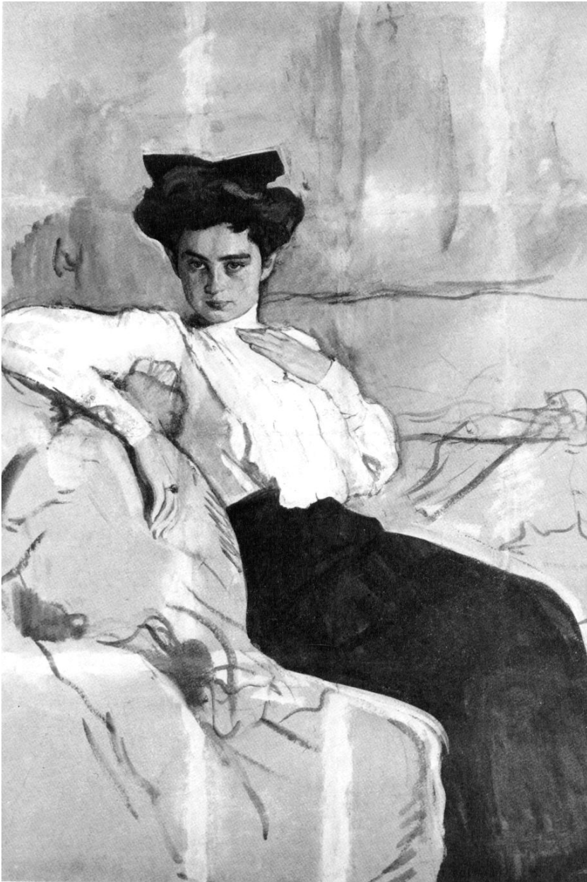
В.А. Серов. Портрет Генриетты Кишман