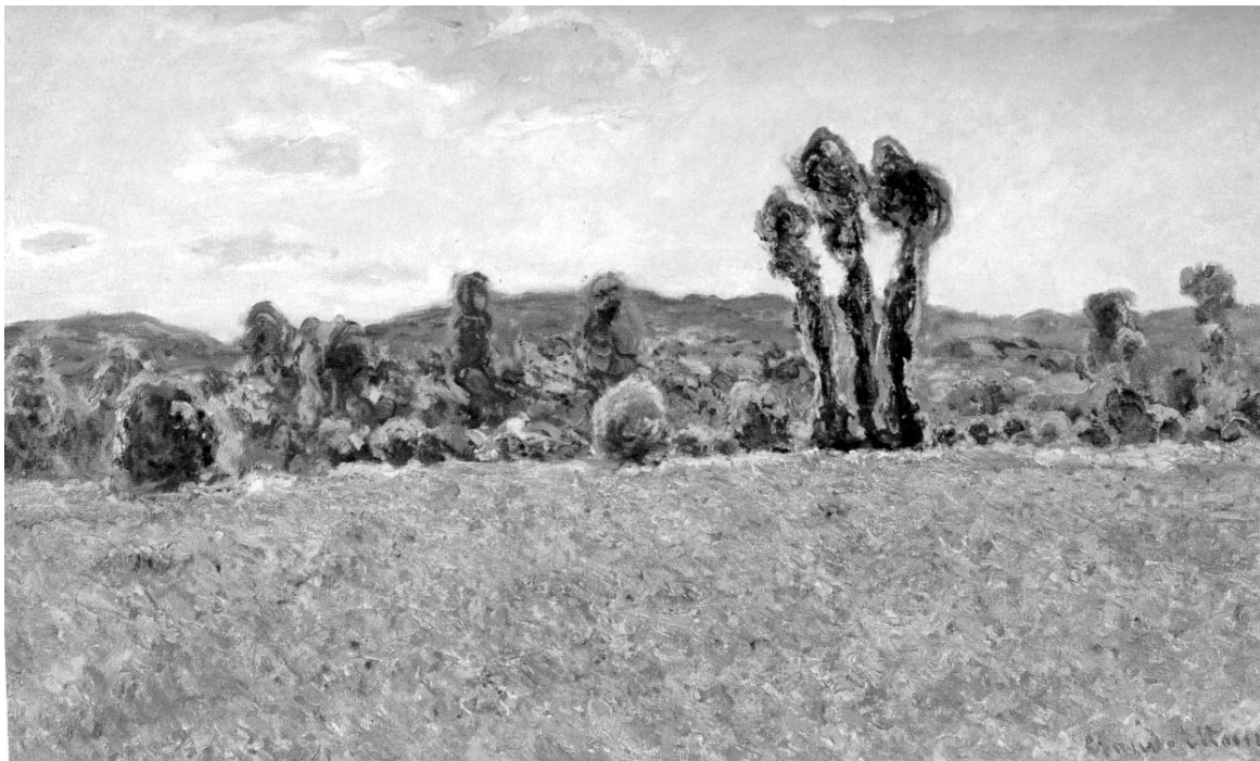
К. Моне. Поле маков