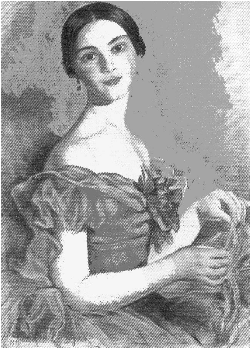
З.Е. Серебрякова. Портрет балерины Е.Н. Гейденрейх в красном. 1923