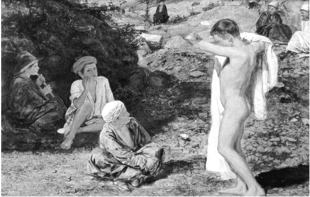
А.А. Иванов. Семь мальчиков