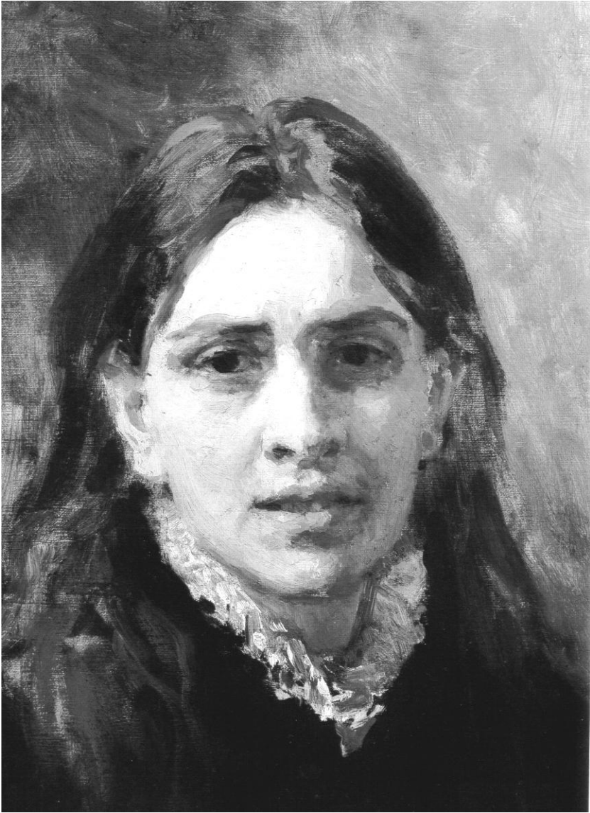
И.Е. Репин. Портрет П.А. Стрепетовой, фрагмент. 1882.