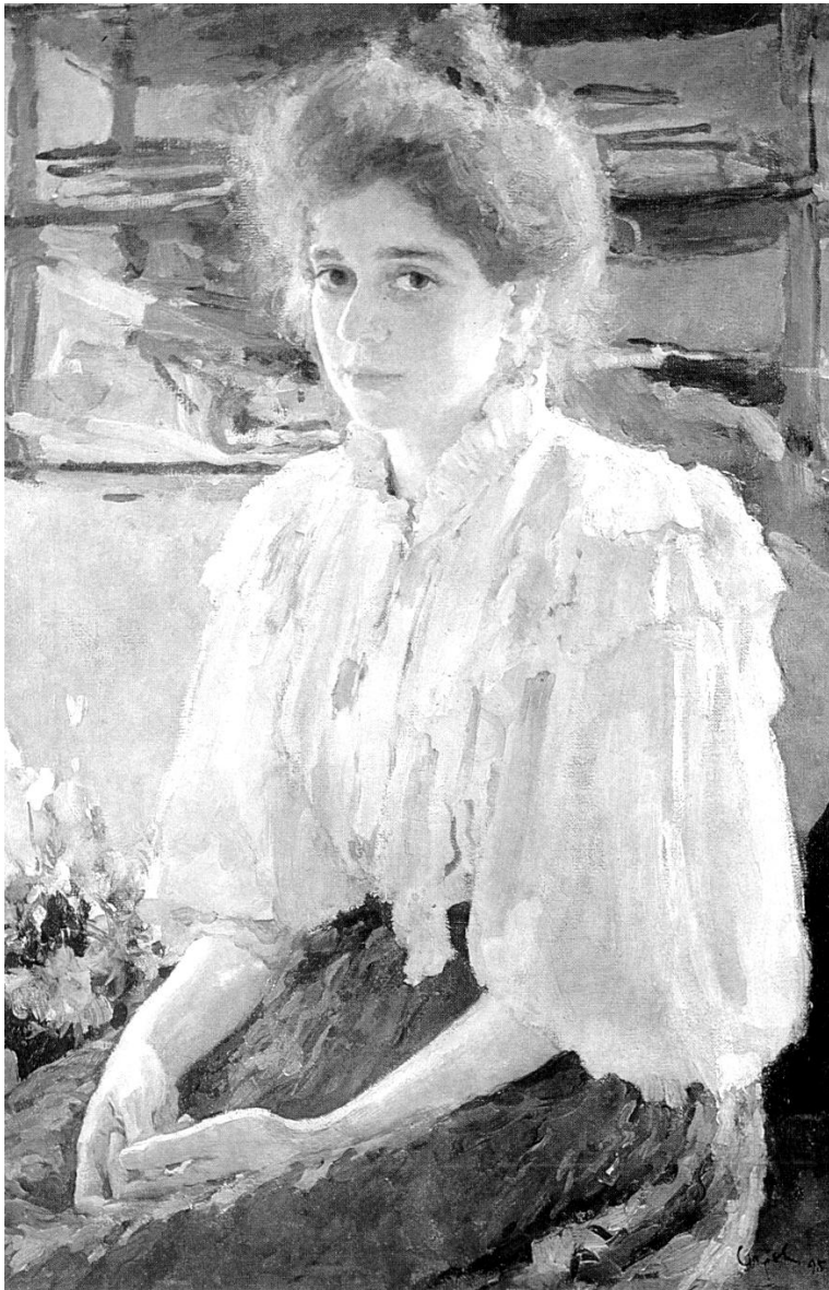
В.А. Серов. Девушка, освещенная солнцем