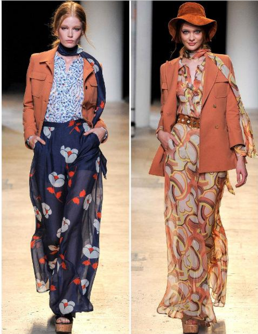
Pal & Joe