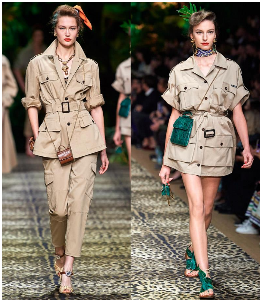
Dolce & Gabbana