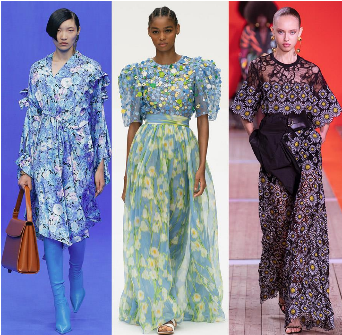
Balenciaga, Carolina Herrera, Elie Saab