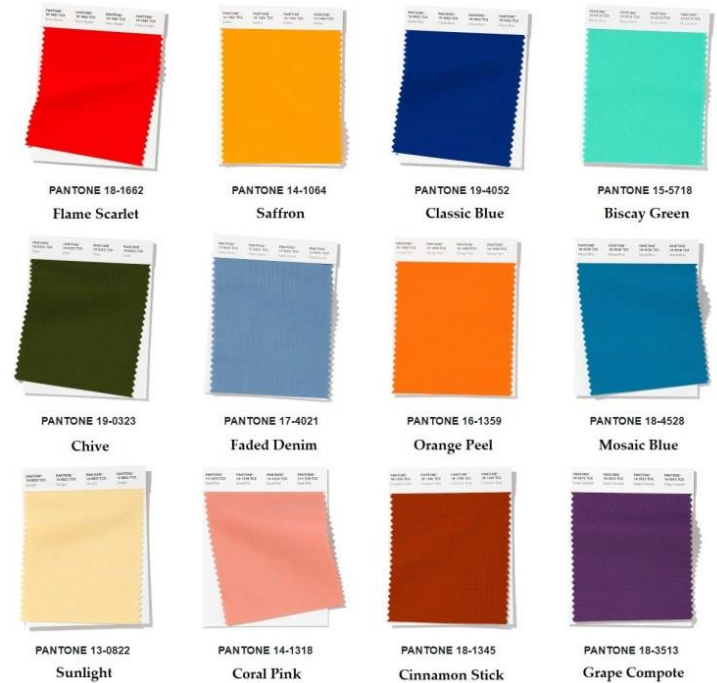
Top Color PANTONE Spring Summer 2020 NY