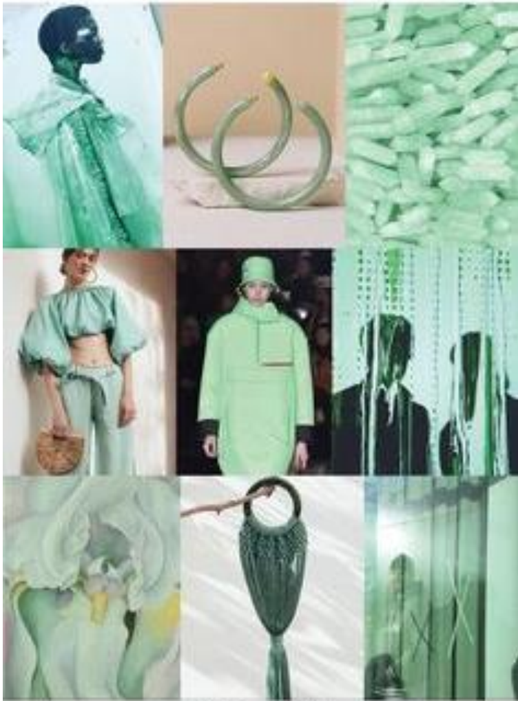
NEO MINT MUST-HAVE 2020 COLOUR TREND