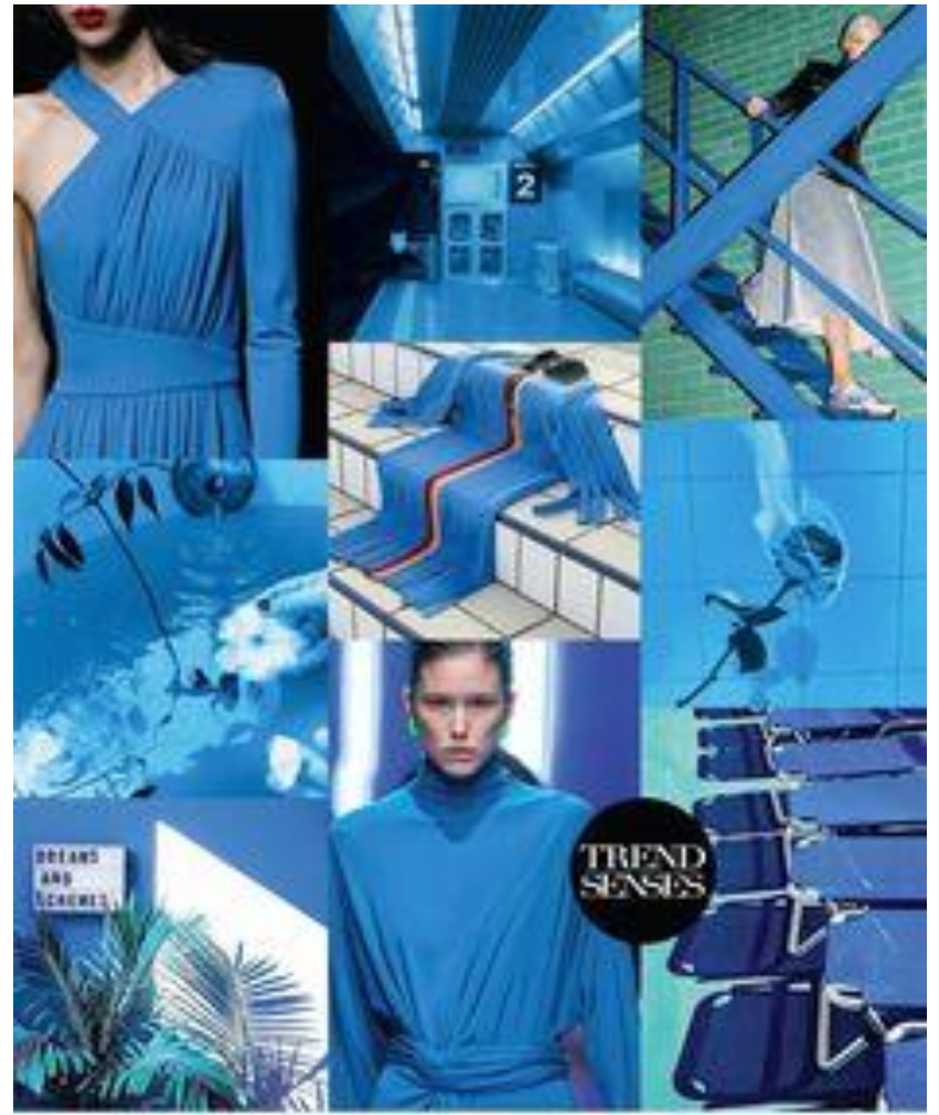
VIVIDLY BLUE / SS 2020

SEE MORE: PINTEREST TREND MOODBOARDS | MAREIKE DE BLIJTER | WWW.TRENDSENS.COM