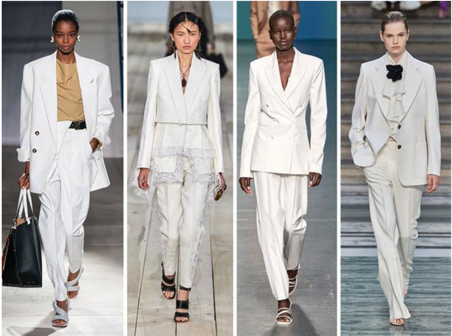
Proenza Schouler, Alexander McQueen, Hugo Boss, Victoria Beckham