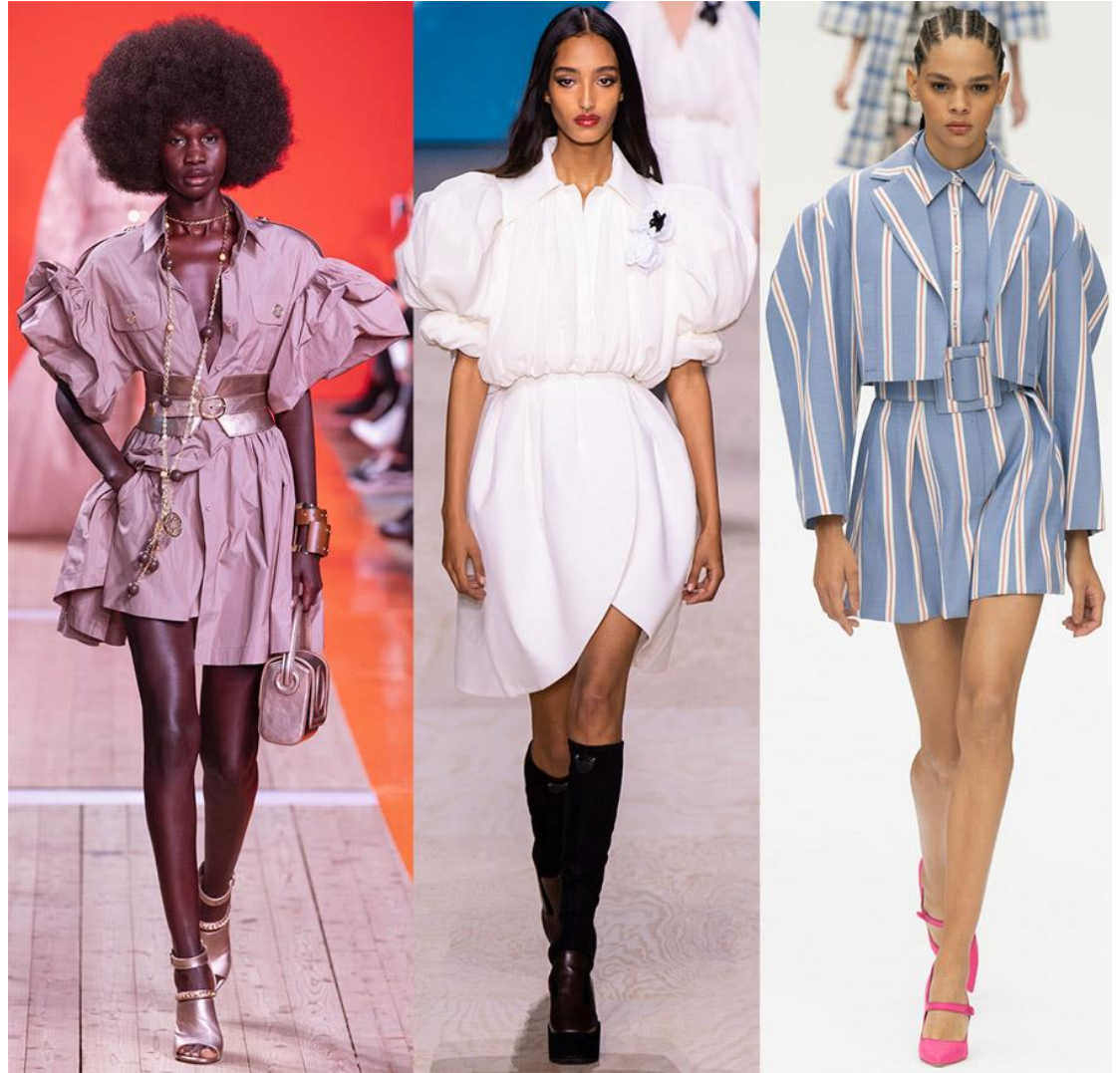
Elie Saab, Louis Vuitton, Carolina Herrera