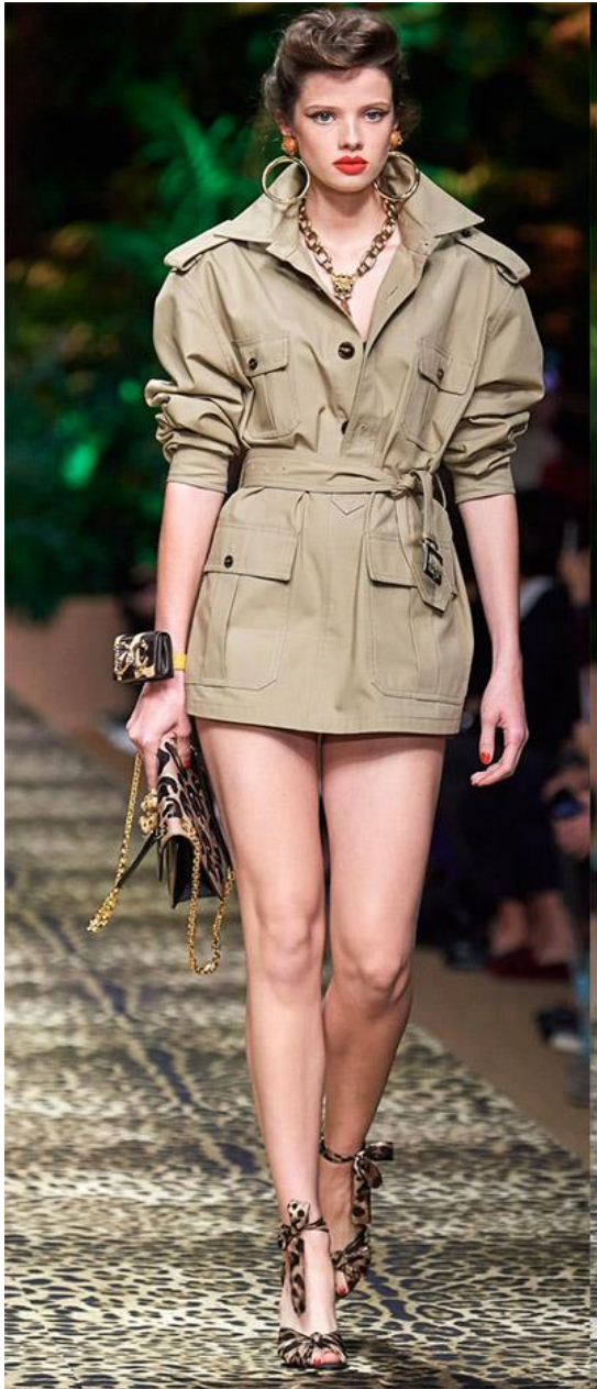
Dolce & Gabbana