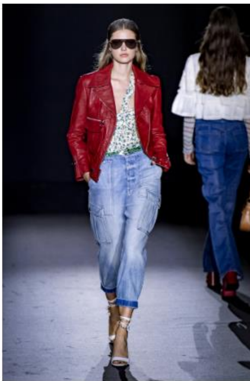
ZADIG & VOLTAIRE