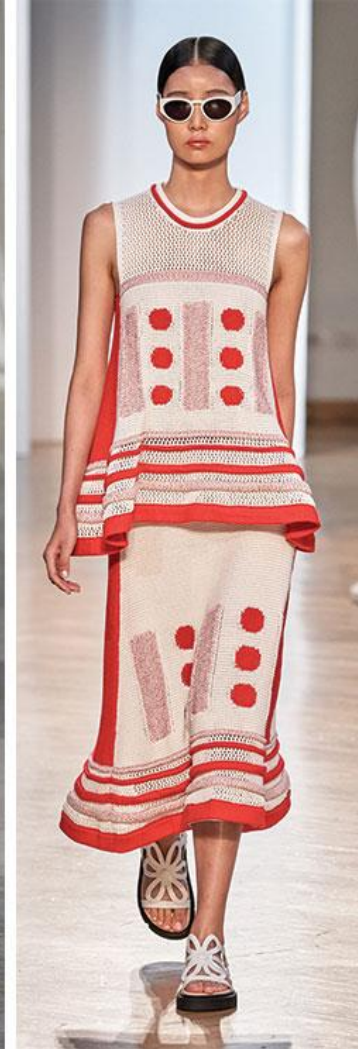
Hugo Boss, Marni, Staud, Vivetta