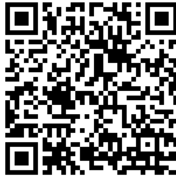
Образец заполнения заявления Р11001