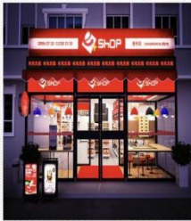
商店 [shāng diàn] магазин