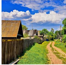
Деревня 村 【Cūn】