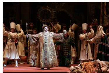
Опера 歌剧 【gējù】