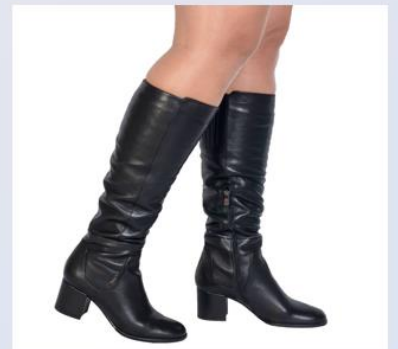
сапоги 靴子 【Xuēzi】