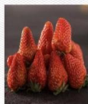
草莓 [cǎo méi] клубника