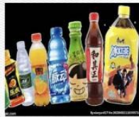
饮料 [yǐn liào] ] напиток