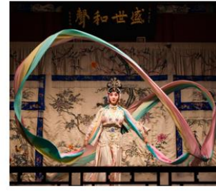
пекинская опера 京剧 【jīngjù】