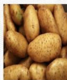
土豆 [tǔ dòu] картофель