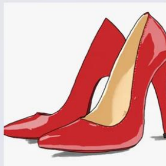
Высокий каблук 高跟鞋 【Gāogēnxié】