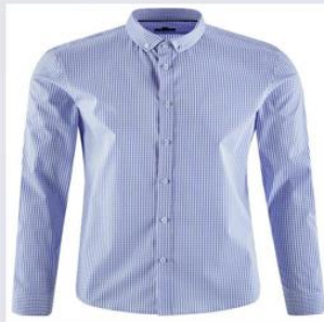
рубашка 衬衫 【Chènshān】