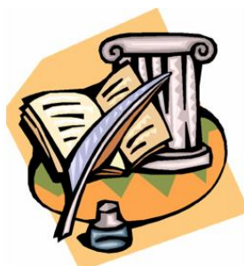
История 历史 【lìshǐ】