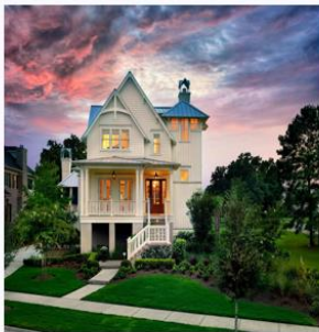
дом 房子 【Fángzi】