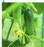
黄瓜 [huáng guā] огурец