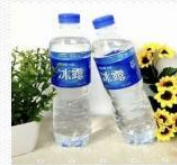
水 [shuǐ] вода