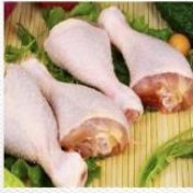
鸡腿 [jī tuǐ] ножка