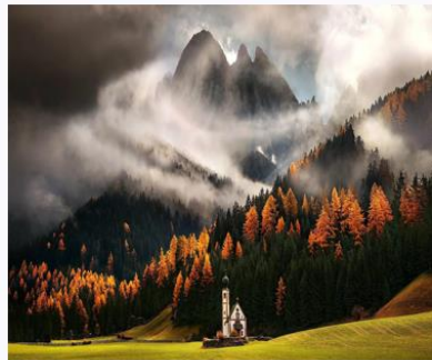
пейзаж 风景 【Fēngjǐng】