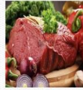
牛肉 [niú ròu] говядина