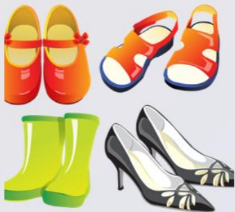
обувь 鞋子 【Xiézi】