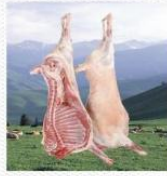
羊肉 [yáng ròu] баранина