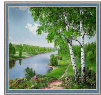
Дерево 树 【Shù】