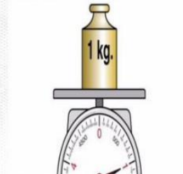
килограмм 公斤 [gōng jīn ]