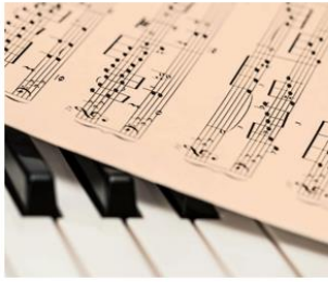
Музыка 音乐 【yīnyuè】