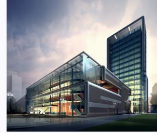
здание 建筑 【Jiànzhú】