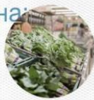
胡萝卜 [hú luó bo] морковь