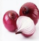
洋葱 [yáng cōng] лук