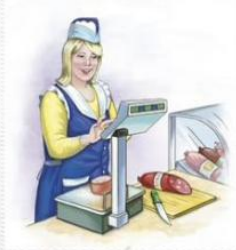
Продавец 卖方 [mài fāng ]