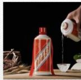
白酒 [bái jiǔ] водка