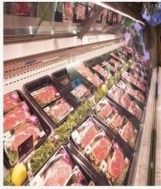
肉食区 [ròu shí qū] Мясная зона