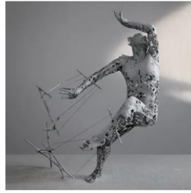
Искусство 艺术 【Yìshù】