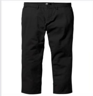
Брюки 裤子 【Kù zi】