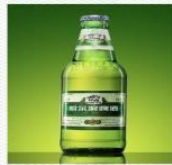
啤酒 [pí jiǔ] пиво