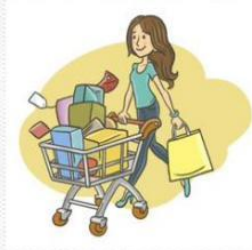
покупатель 买方 [mǎi fāng ]