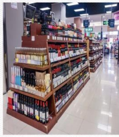
酒水区 [jiǔ shuǐ qū] Зона для напитков