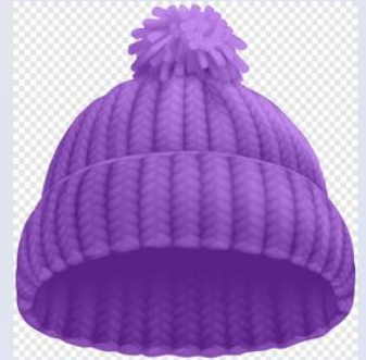
шапка 帽子 【Màozi】