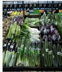
蔬菜区 [shū cài qū] овощная зона