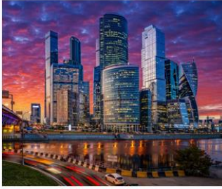
Город 城市 【Chéngshì】