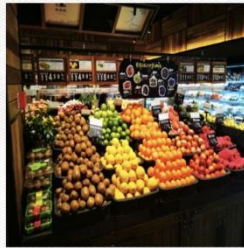
水果区 [shuǐ guǒ qū] фруктовая зона