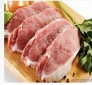
猪肉 [zhū ròu] свинина