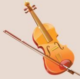
Скрипка 小提琴 【Xiǎotián】