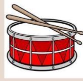
Барабан 鼓 【Gǔ】