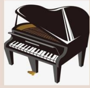
Пианино 钢琴 【Gāngqín】