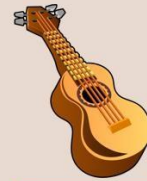
Гитара 吉他 【Jítā】