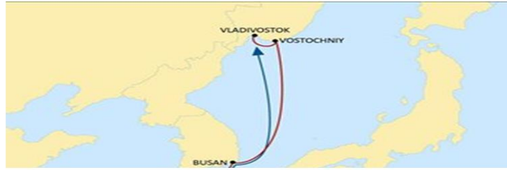
Базовая схема работы грузоотправителей с линией ONE